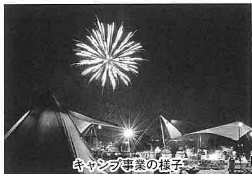
キャンプ事業の様子