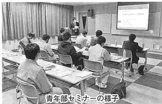
青年部セミナーの様子

昨年は、補助金に関する知識習得を目的としたセミナーを開催した他、地域活性化事業として大池公園を活用したオートキャンプ事業を実施しました。若手経営者が自分たちで考え、力を合わせ行う事業