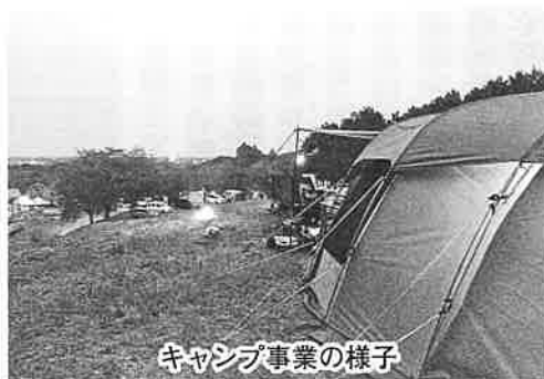
キャンプ事業の様子